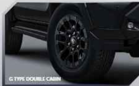
G TYPE DOUBLE CABIN

BLACK FRONT GRILLE (SINGLE CABIN & E TYPE DOUBLE CABIN)