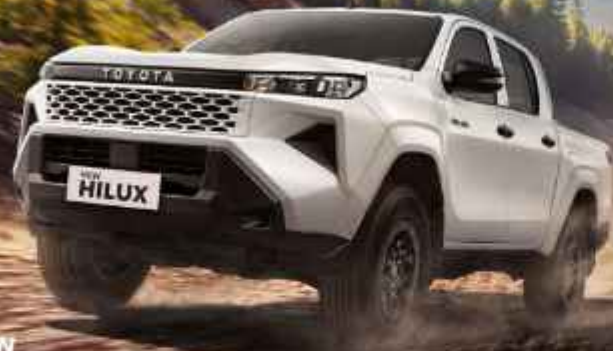
E TYPE DOUBLE CABIN

Mud Tire Option Available. Contact Your Nearest Dealer