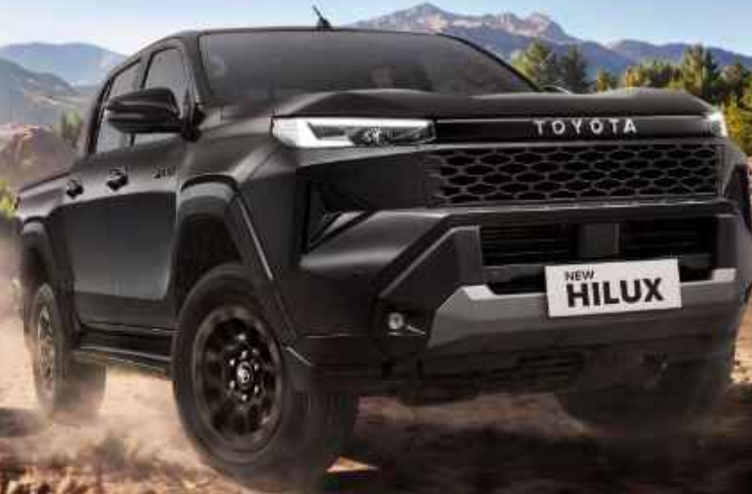
G TYPE DOUBLE CABIN

Mud Tire Option Available. Contact Your Nearest Dealer