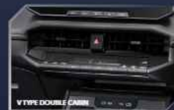
AUTO COOLER DUAL ZONE (V & BEV TYPE DOUBLE CABIN)