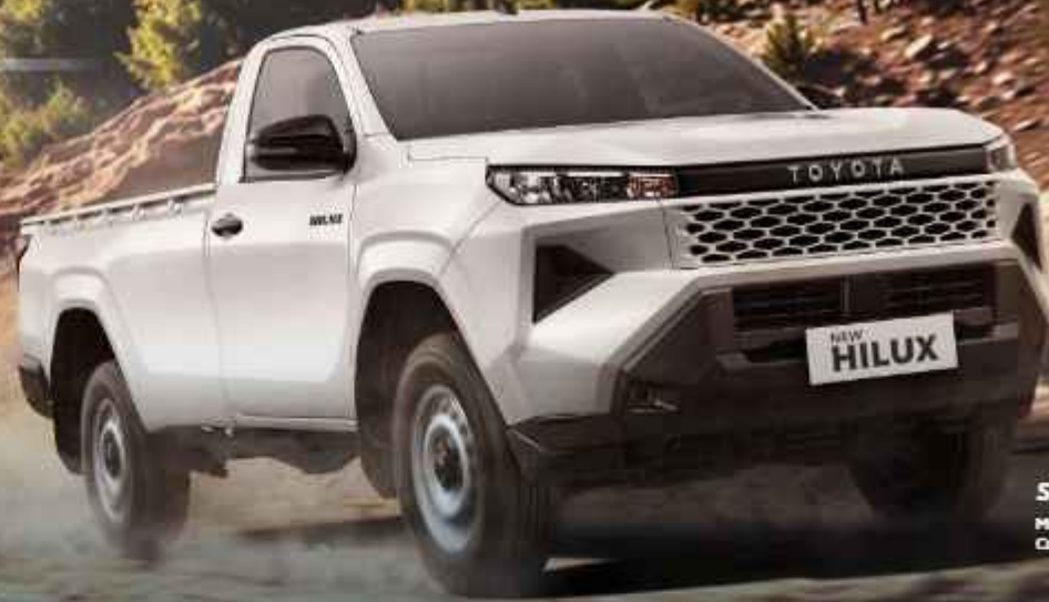
SINGLE CABIN Mud Tire Option Available. Contact Your Nearest Dealer.

New Hilux datang dengan tipe Single Cabin yang memiliki tampilan yang tegas melalui desain eksterior yang modern dan tangguh untuk membawa setiap muatan agar Anda bisa terus melaju tanpa henti di setiap rutinitas.