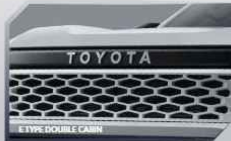
E TYPE DOUBLE CABIN

LED HEADLAMP DESIGN (E TYPE DOUBLE CABIN & SINGLE CABIN)