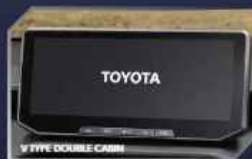
12.3" HEAD UNIT WITH SMARTPHONE CONNECTIVITY (V TYPE DOUBLE CABIN)

Ke mana pun tujuan, selalu terkoneksi dengan fitur canggih di dalam kabin. Dari info kendaraan dan hiburan modern, hingga mode berkendara untuk setiap medan, kenyamanan serta kemudahan selalu ada di setiap perjalanan.