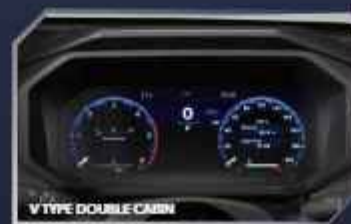
12" TFT MULTI-INFORMATION DISPLAY WITH TIRE PRESSURE MONITORING SYSTEM (TPMS) (V TYPE DOUBLE CABIN)