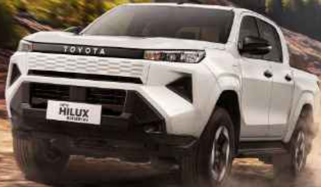
BEV TYPE DOUBLE CABIN