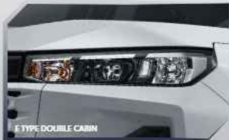
E TYPE DOUBLE CABIN

New Hilux hadir dalam varian G Type Double Cabin dan E Type Double Cabin dengan karakter eksterior yang kokoh dan berwibawa di setiap sudut. Didukung performa tangguh, siap menghadapi berbagai tantangan serta menemani beragam aktivitas dan petualangan.