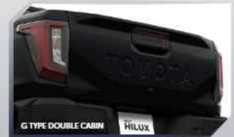
G TYPE DOUBLE CABIN

17" ALLOY WHEEL (G & E TYPE DOUBLE CABIN)